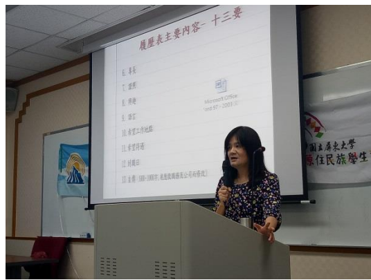
說明履歷撰寫技巧