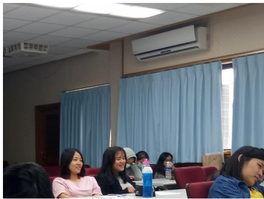
學生認真聆聽講座