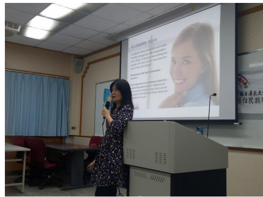
保持微笑是重要關鍵