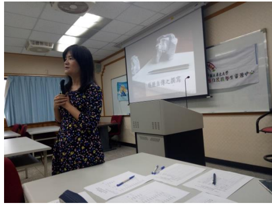
講師介紹講座主題