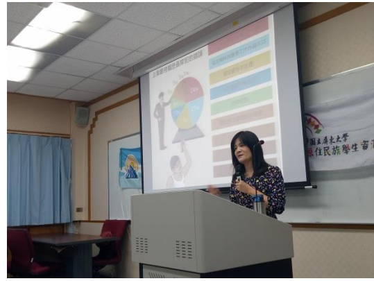
講師說明履歷表撰寫注意事項